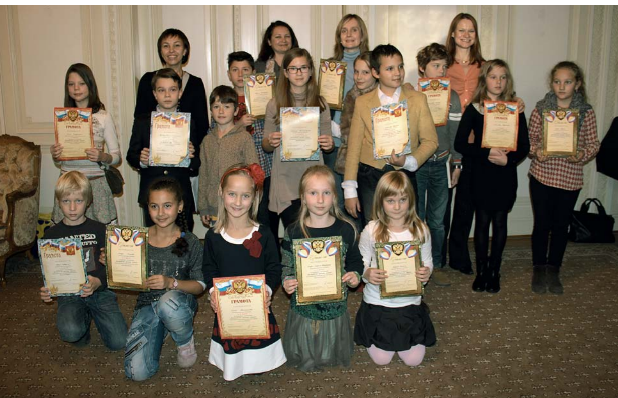
Лучших чествовали в Посольстве Российской Федерации в Берне в день проведения педагогической конференции.